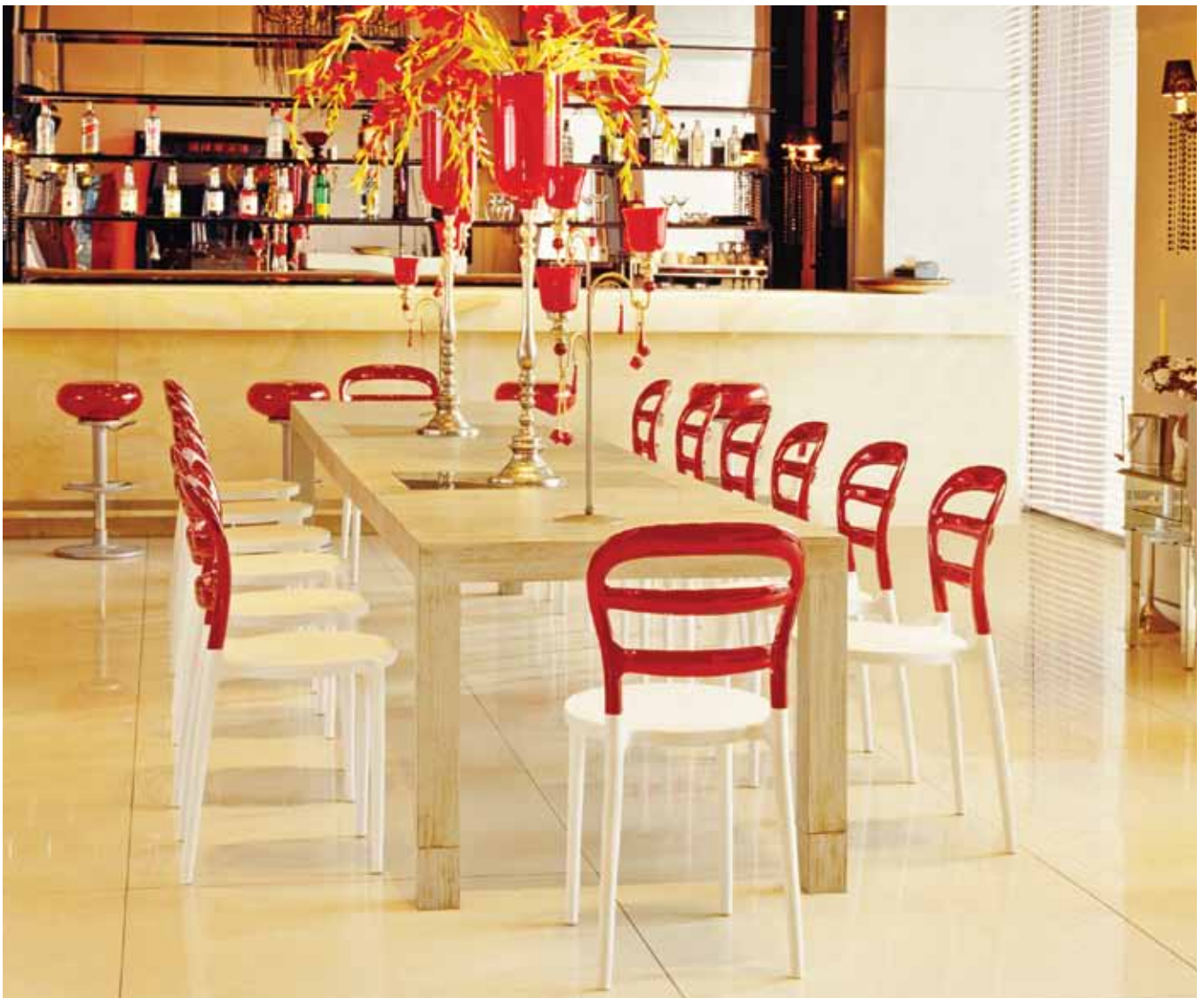
Le siège et les pattes des chaises Miss bibi (CATG-3561) sont faits de polypropylène renforcée de fibre de verre et le dossier, de polycarbonate clair moulé.